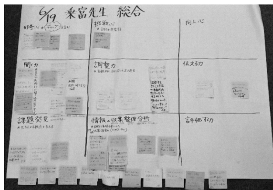
資料4 汎用性の高い手立て

具体的な手立てが明らかになった後、その手立てについて、参観者が今後の自分の授業の中で生かすことができるようなものを簡単に記述し、9つの資質・能力ごとに整理する(資料4)。整理された表をもとに、より汎用性の高い手立てとなるよう協議しながら抽象化していく。