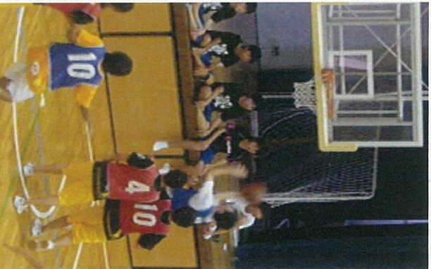
男子バスケット決勝戦 2B対3C