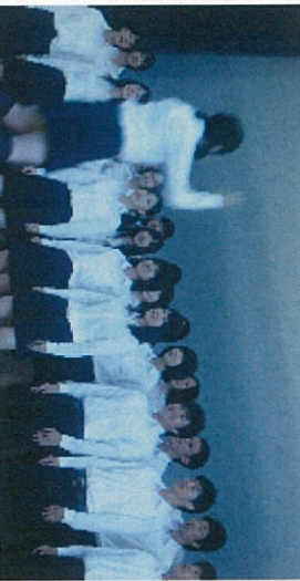
最優秀賞を受賞した3B 「流浪の民」